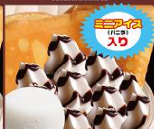
チョコクリームスペシャル ¥600 (税込) CHOCOLATE&CREAM+ICE