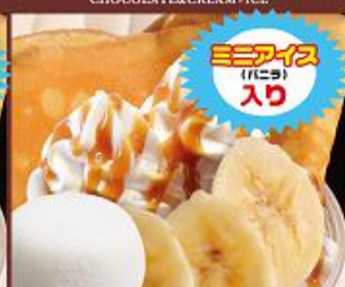
バナナキャラメルスペシャル ¥650 (税込) BANANA&CARAMEL+ICE