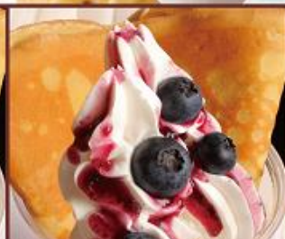
ブルーベリー ¥550 (税込) BLUEBERRYSAUCE