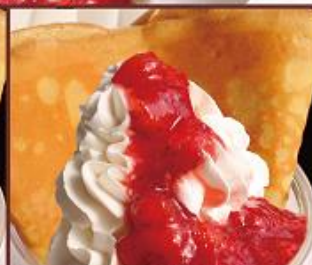
つぶつぶイチゴ ¥550 (税込) STRAWBERRYSAUCE