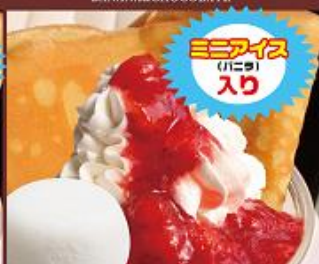
つぶつぶイチゴスペシャル ¥650 (税込) STRAWBERRYSAUCE+ICE