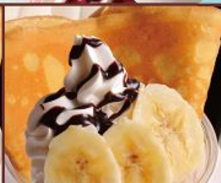
バナナチョコ ¥550 (税込) BANANA&CHOCOLATE