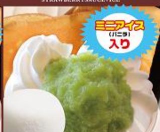
ずんだクリームスペシャル ¥650 (税込) ZUNDA&CREAM+ICE