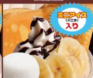
バナナチョコスペシャル ¥650 (税込) BANANA&CHOCOLATE+ICE