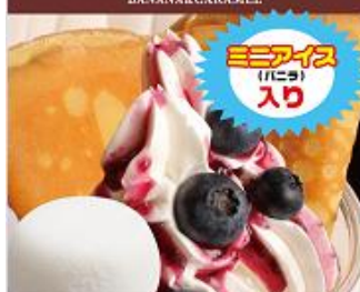
ブルーベリースPECIAL ¥650 (税込) BLUEBERRYSAUCE+ICE