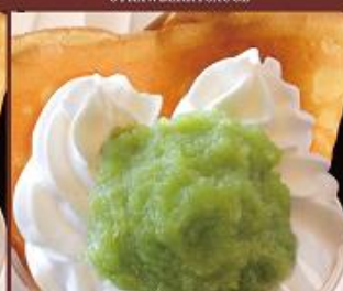
ずんだクリーム ¥550 (税込) ZUNDA&CREAM