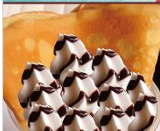
チョコクリーム ¥500 (税込) CHOCOLATE&CREAM