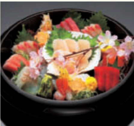
三陸海の幸お造り盛り合わせ (4人前) ¥10,000