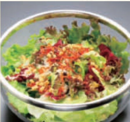
シーザーサラダ(4人前) ¥2,000

新鮮野菜をアンチョビやガーリックを効かせた特製ドレッシングで和え、パルミジャーノチーズ、カリカリベーコン、クルトンをあしらったホテル一押しのサラダです。