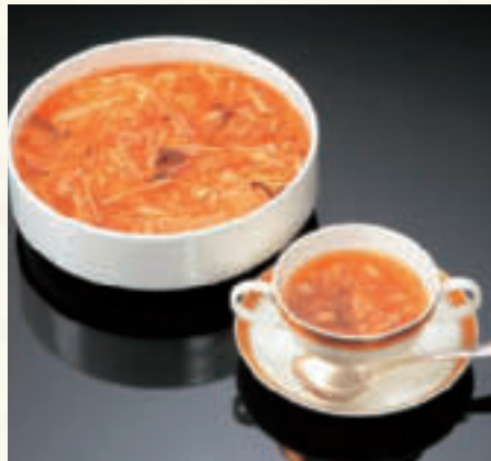
フカヒレ薬膳スープ(8人前) ¥4,800

新鮮野菜をアンチョビやガーリックを効かせた特製ドレッシングで和え、パルミジャーノチーズ、カリカリベーコン、クルトンをあしらったホテル一押しのサラダです。