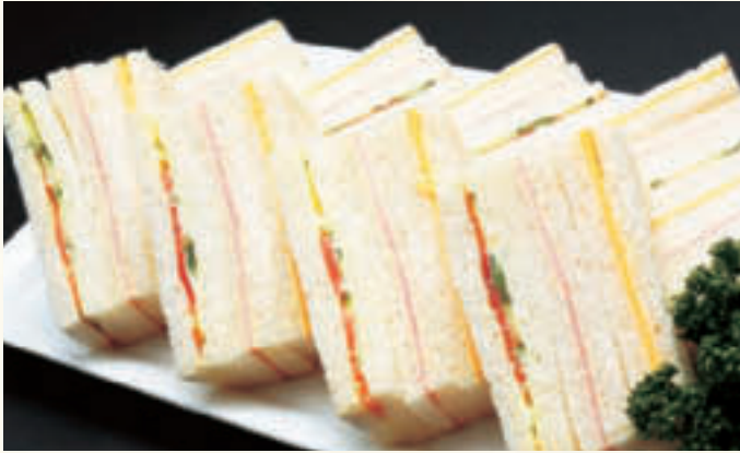
ミックスサンドイッチ(4人前) ¥3,000