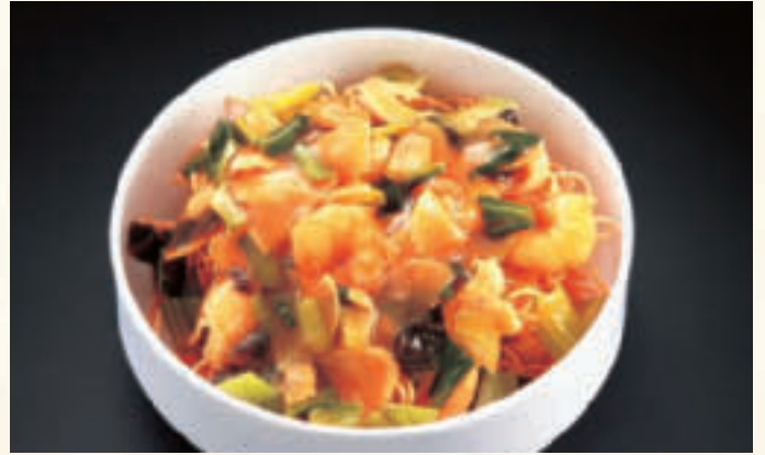
五目あんかけ堅焼そば(4人前) ¥2,000