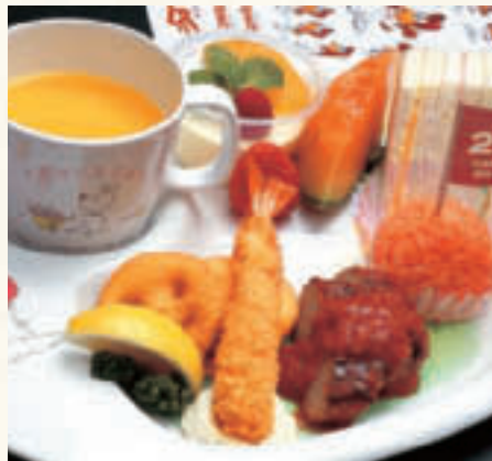
お子様プレート(1人前) ¥1,500